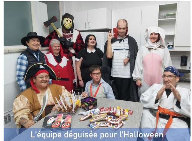
L'équipe déguisée pour l'Halloween