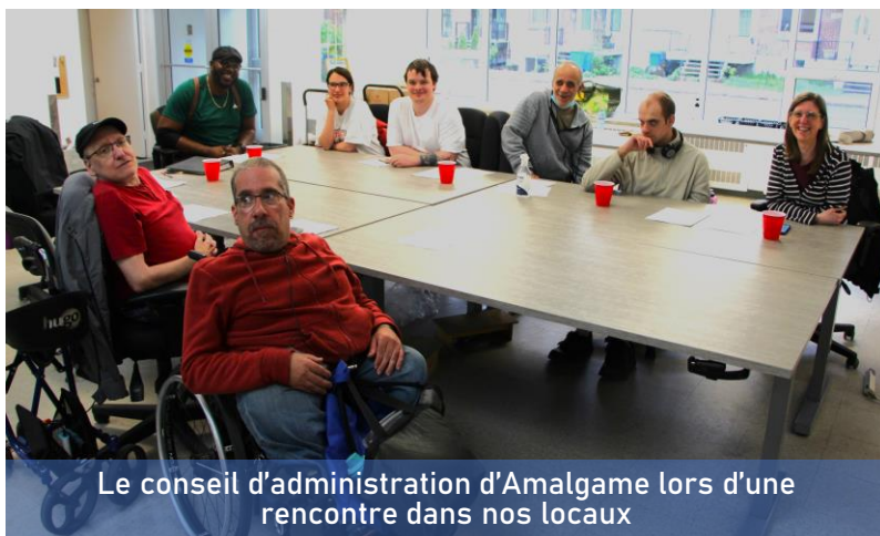
Le conseil d'administration d'Amalgame lors d'une rencontre dans nos locaux

Le conseil d'administration, indépendant du réseau public, est garant de la liberté de l'organisme à déterminer sa mission, ses approches, ses pratiques et ses orientations. Aucun représentant de bailleur de fonds ou d'employé de l'organisme n'y siège. Il s'est réuni 5 fois cette année.