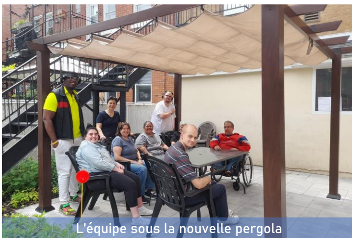
L'équipe sous la nouvelle pergola

Nous continuons également de promouvoir l'accessibilité universelle en participant à des rencontres sur ce thème organisées par la Ville de Montréal, l'Arrondissement de Verdun et le RAPLIQ. Et lorsque l'occasion se présente, il nous fait toujours plaisir de souligner les efforts d'accessibilité des commerces du quartier.